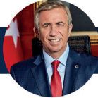
Mansur YAYAŞ Ankara Büyükşehir Belediye Başkanı