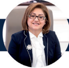
Fatma ŞAHİN Gaziantep Büyükşehir Belediye Başkanı