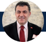
Faruk DEMİR Ardahan Belediye Başkanı

12:45 – 14:00 ÖĞLE YEMEĞİ GALA ŞAŞAM MERKEZİ