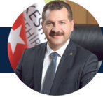
Yücel YILMAZ Balıkesir Büyükşehir Belediye Başkanı

“Geleceğin Kentlerinde İşbirliği ve Dayanışma”